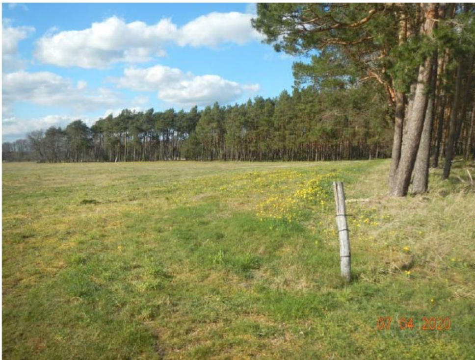
Kiefernforsten umgrenzen im Norden und Nordosten das Plangebiet, hier ein Blick von der östlichen Gebietsgrenze in nordwestlicher Richtung.