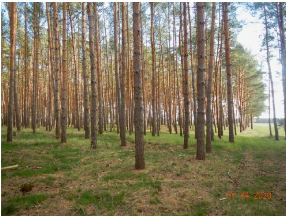
Die Kiefernforsten sind strukturarmer Altersklassenwald.